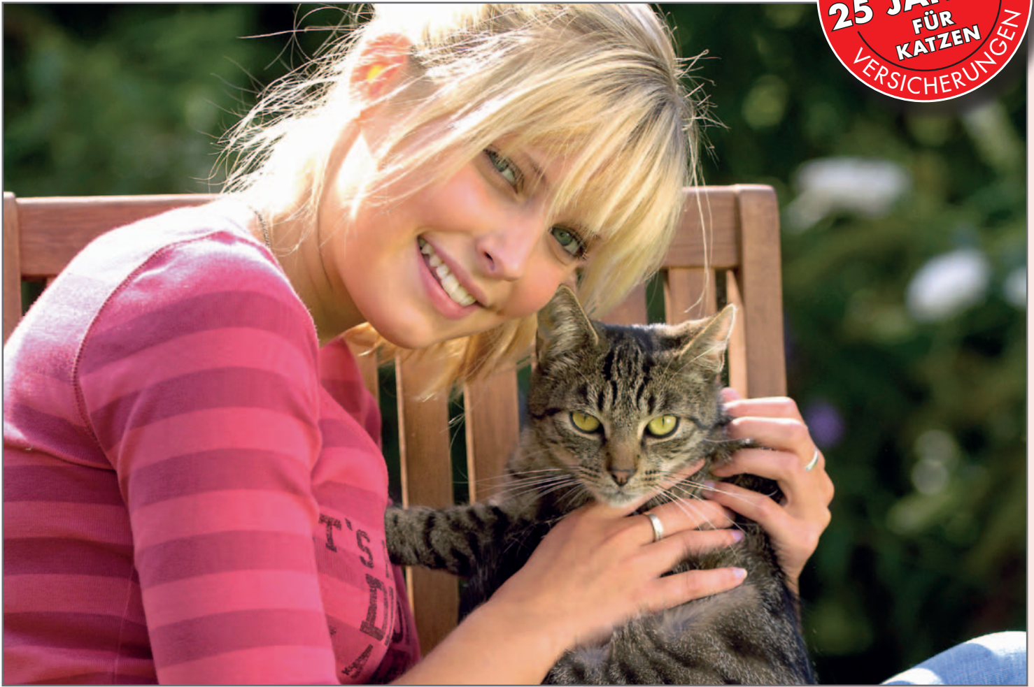
Als Privatpatient zum Tierarzt.

TIERKRANKEN- SEIT MEHR ALS 25 JAHREN FÜR KATZEN VERSICHERUNGEN